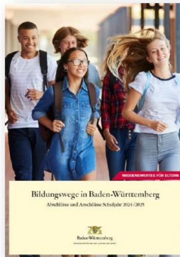
Broschüre „Bildungswege in Baden-Württemberg“