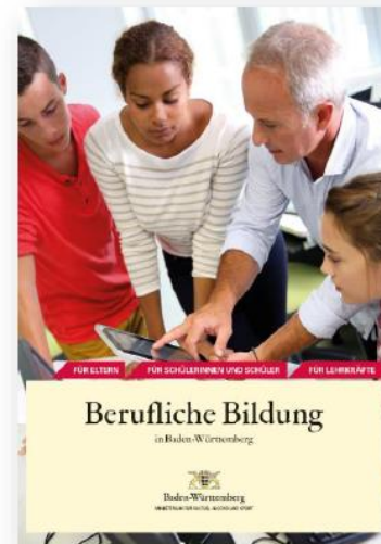
Broschüre „Berufliche Bildung in Baden-Württemberg“